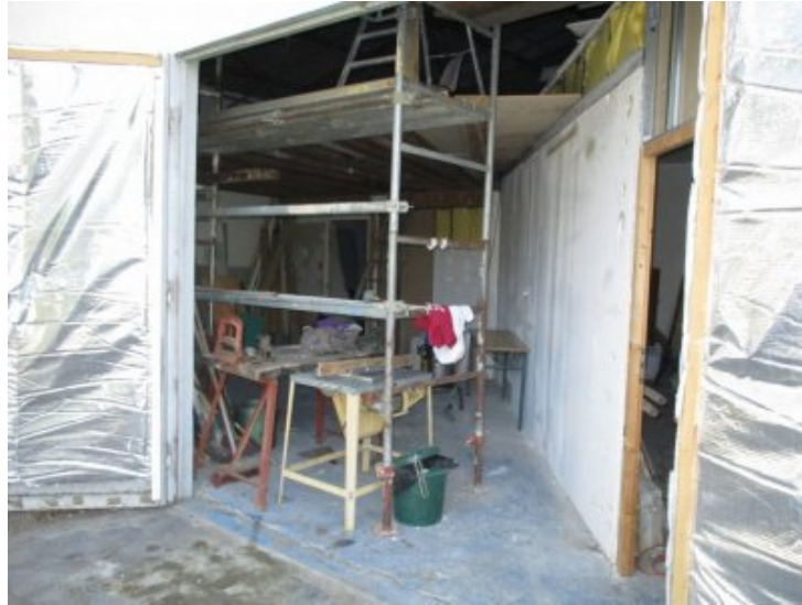
Photos 5 - Août - Opération isolation du toit