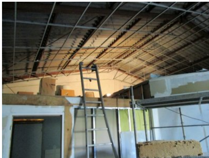
Photos 3 - Juillet - Opération laine de verre