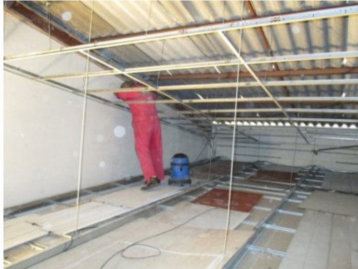
Photos 7 - Août - Dépoussiérage avant isolation