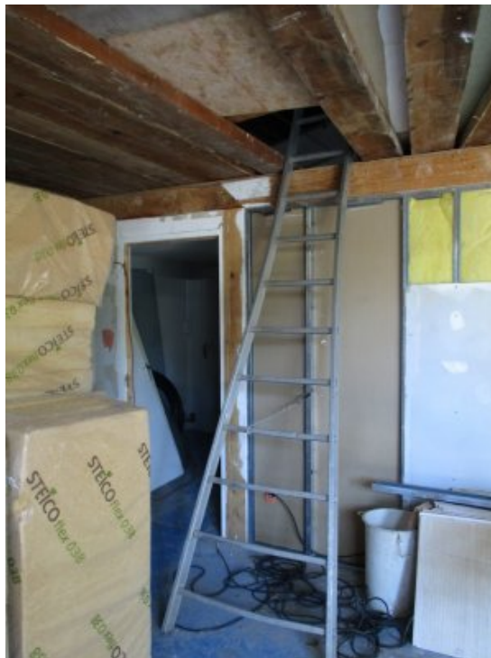
Photo 6 - Août - Opération isolation