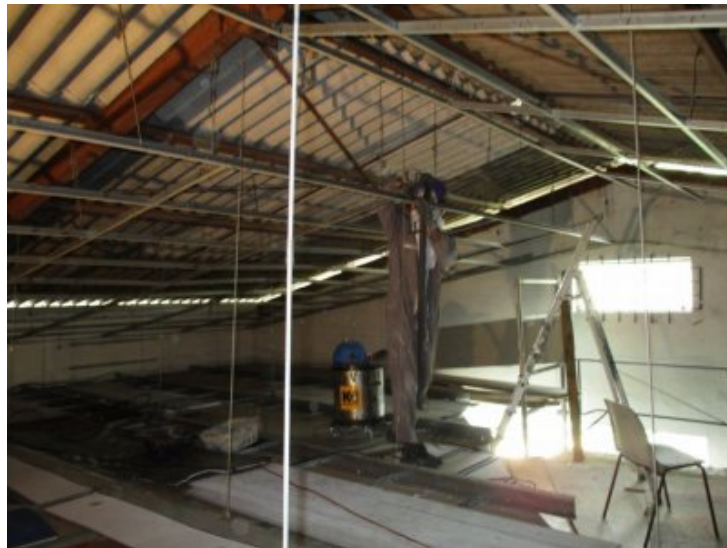
Photos 8 - Août - Dépoussiérage avant isolation