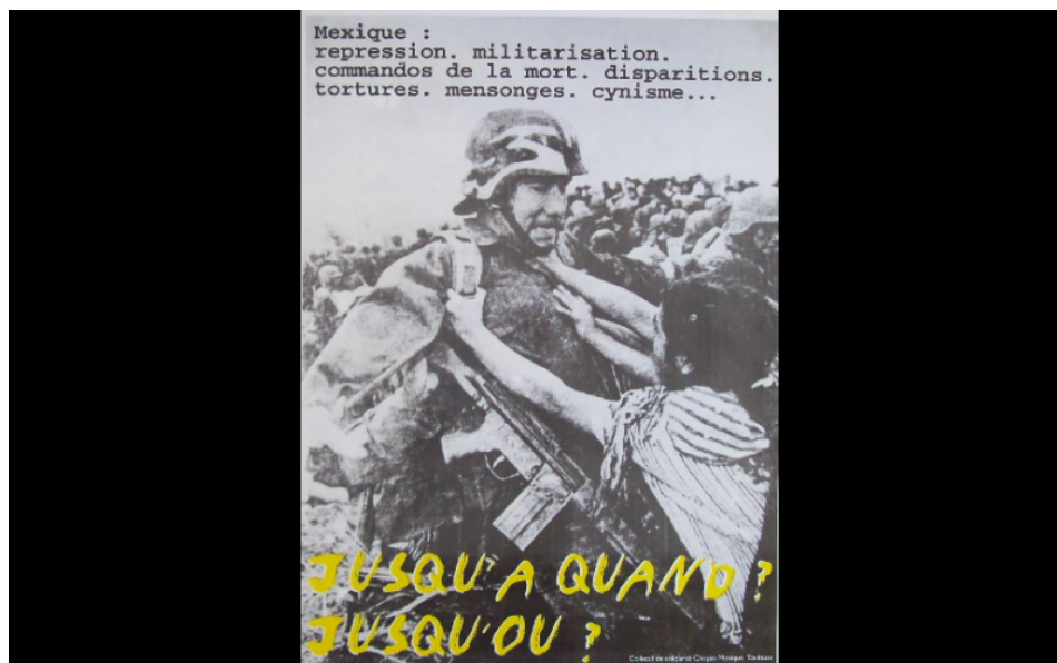
affiche répression Mexique, collectif chiapas, Toulouse