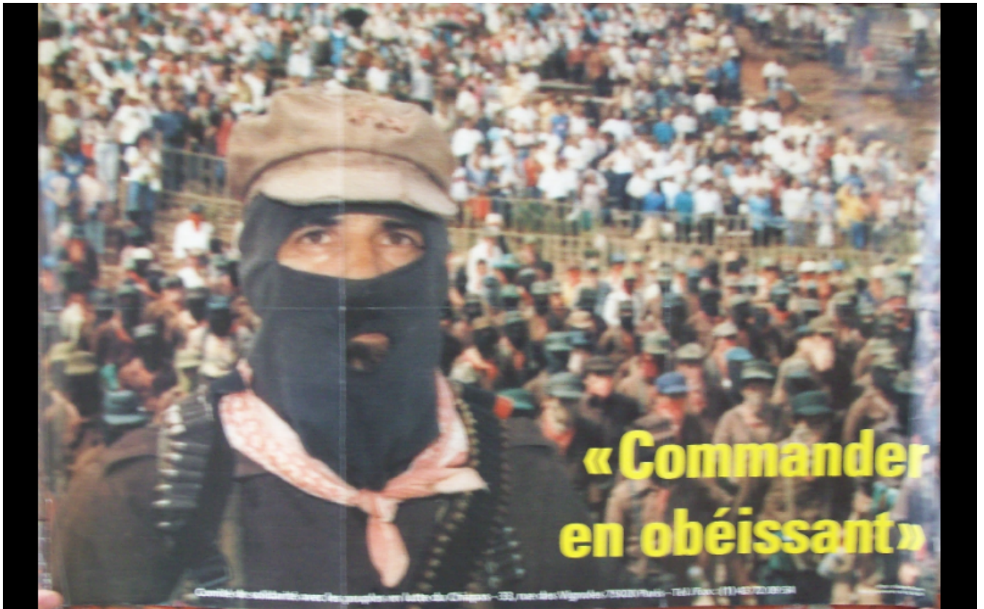
affiche Marcos, Comité Chiapas Paris