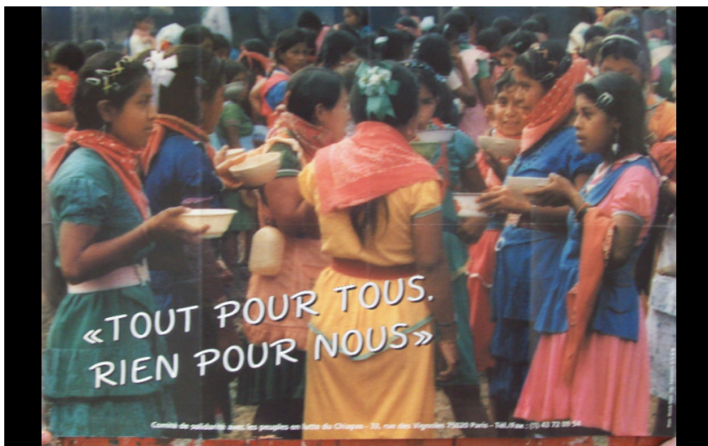
affiche Chiapas, comité Chiapas Paris