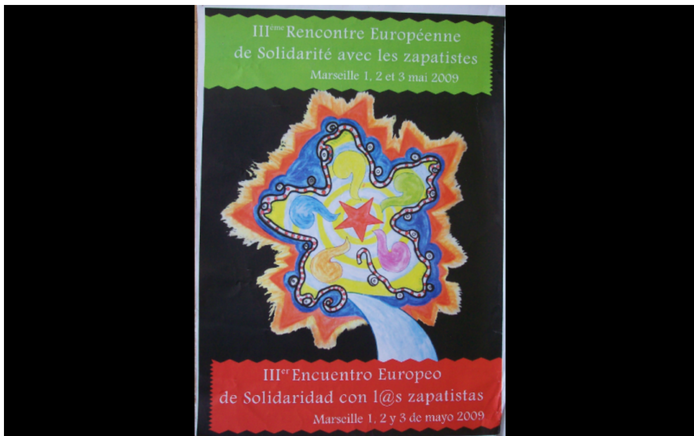
affiche rencontres zapatistes, Marseille, 2009