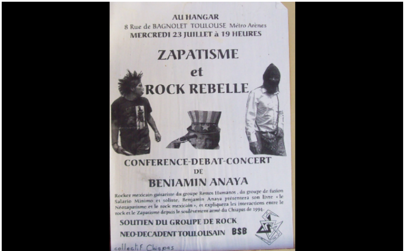
affiche conférence zapatisme et rock, collectif Chiapas, Toulouse, 2003