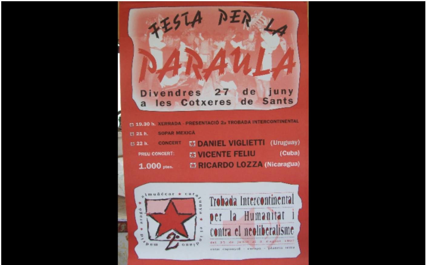
fête caravane zapatiste, Barcelone, 1997, 45x60.