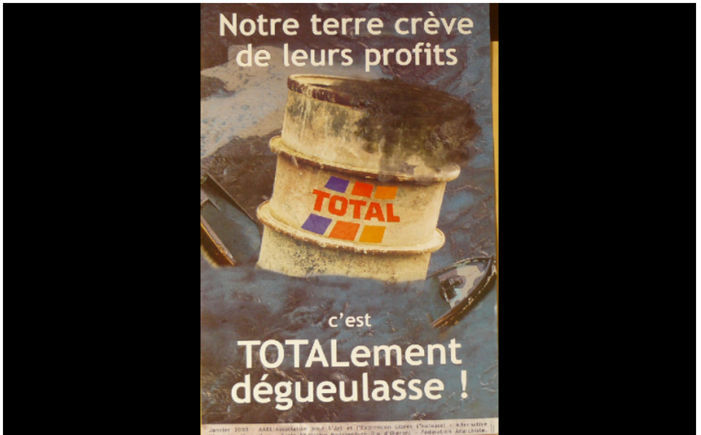
affiche Total-Erika, AAEL, 2000