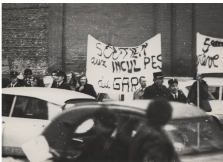
Manifestation devant la prison St Michel à Toulouse