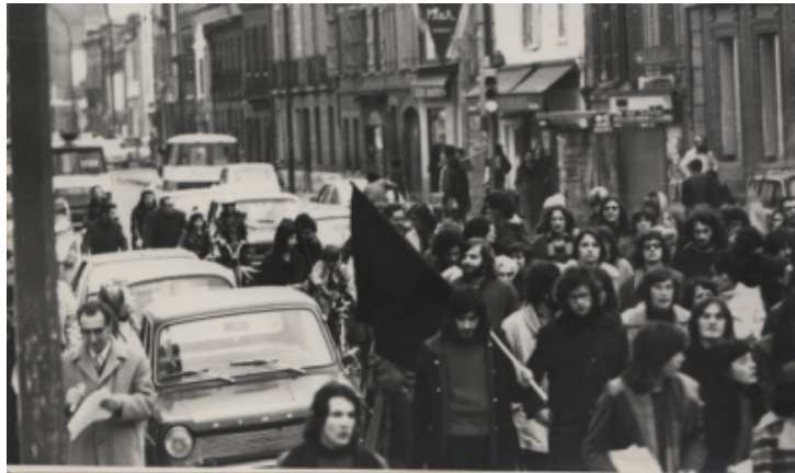
Manifestation du comité d'entraide à Toulouse