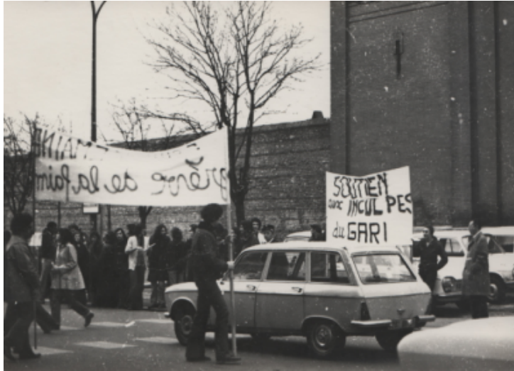
Manifestation devant la prison St Michel à Toulouse