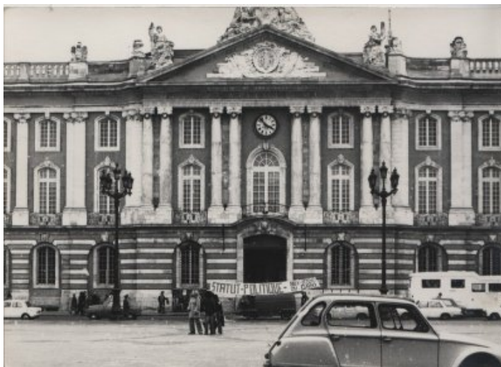
Place du Capitole