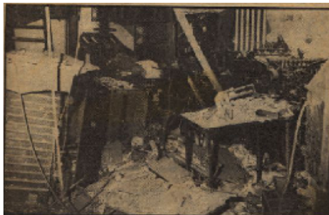
Attentat contre l'imprimerie 34 (I34)