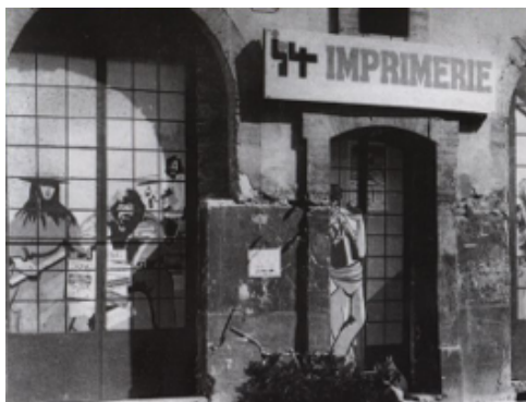
Façade de l'imprimerie après une réparation rapide et sommaire