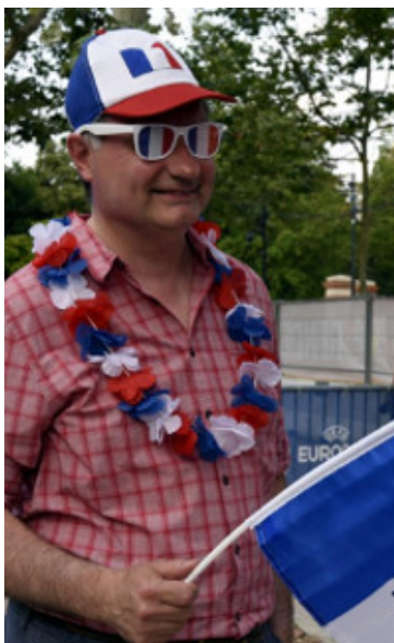
Jean-Luc Moudenc - Fan zone lors de la Coupe d'Europe de football en juin 2016.