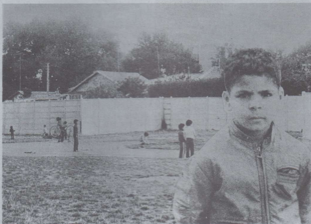
Petit terrain vague où jouent les enfants derrière les immeubles de la briqueterie. Vue panoramique du MUR. Derrière on peut remarquer les toits des villas et propriétés privées.

C'est ainsi qu'on voit les petits patrons profiter du fait qu'ils ne comprennent ni ne lisent le français pour les faire travailler dans les pires conditions (bulletins de salaire comportant beaucoup moins d'heures que le travail réellement effectué afin de payer moins de charges sociales); qu'on voit les employés d'administrations (Agence pour l'Emploi, la Sécurité Sociale, l'Aide Médicale...), les commerçants les traiter pire que des chiens et être prêts à tous les comportements qu'ils n'osent avoir avec personne. Ils deviennent plus facilement la tête de turc et les responsables de tous les malheurs: quelque chose a disparu, c'est sûrement le voisin arabe qui l'a volé! C'est devenu tellement ancré dans les mœurs, qu'il n'y a qu'un pas entre ces comportements quotidiens et les taboues touchant au sadisme.