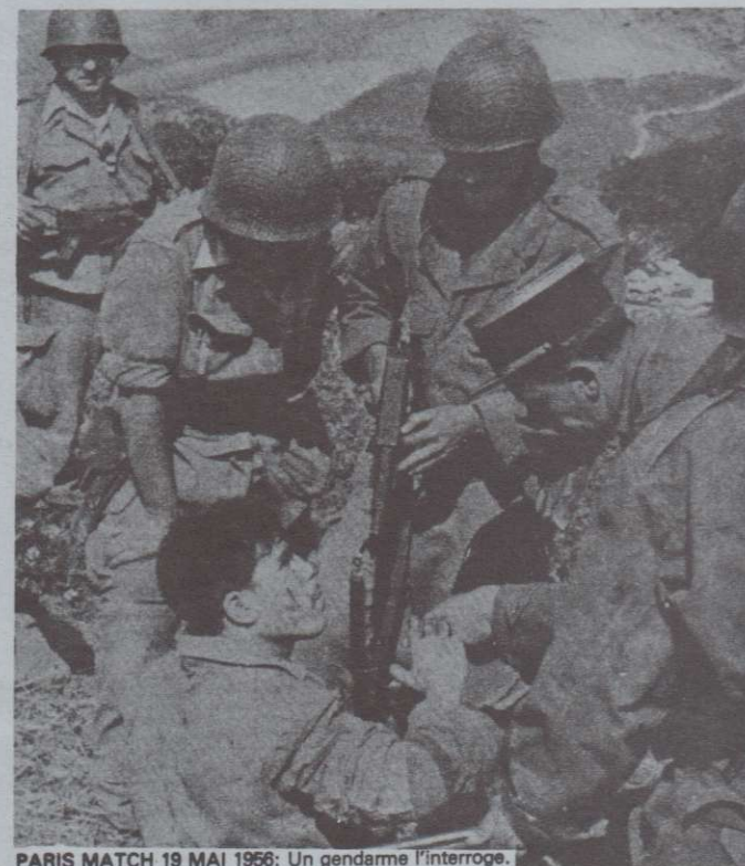
PARIS MATCH 19 MAI 1956: Un gendarme l'interroge.