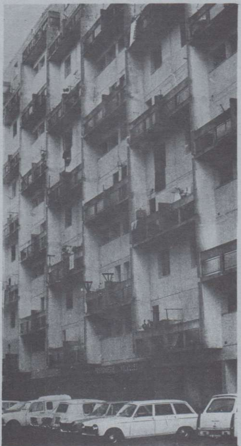
Immeuble du quartier de la briqueterie à Toulouse. Le petit chez soi de l'arabe.

Le racisme par rapport aux arabes, aux espagnols, aux portugais, aux yougoslaves, à tout travailleur immigré marche bon train. Ces derniers arrivent déjà en France dans une situation défavorisée, et sans grande ressource pour se défendre socialement et juridiquement; rien n'est donc plus facile que d'essayer de s'affirmer contre eux. C'est ainsi qu'on voit ces bons français louer le même appartement à dix personnes, chacune payant un loyer entier, sans danger de contestation, et les insulter partout où ils les cotoient, ces «bicots, bougnouls» qui viennent manger leur pain.