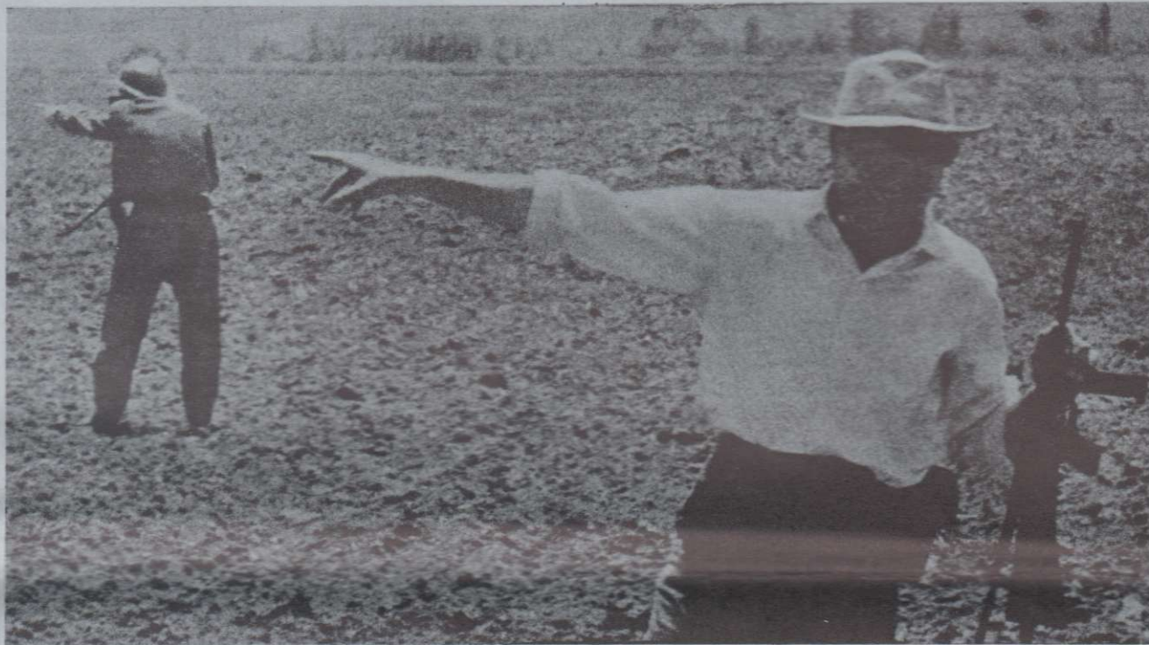
PARIS MATCH 19 MAI 1956: Un fermier montre aux soldats la direction que les arabes prennent.