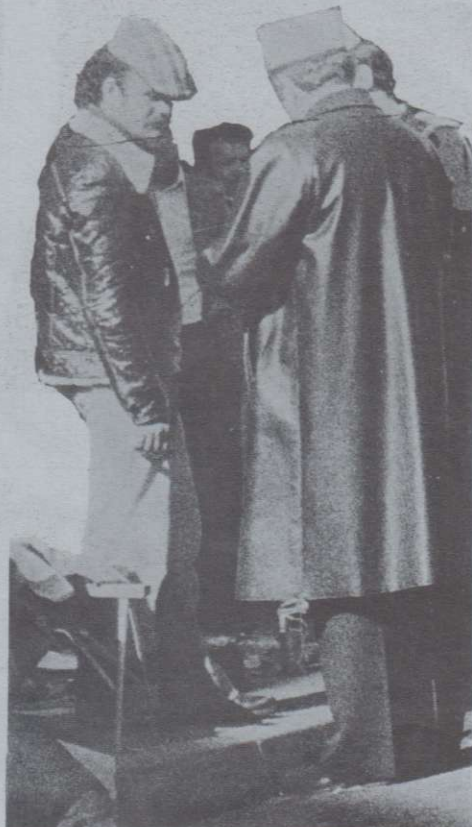
QUOTIDIEN: à St. Serrin contrôle de papiers d'un arabe par les flics un dimanche matin.

Et personne ne se sent coupable: c'est bien connu que les arabes passent de sales quart d'heures au commissariat, qu'ils se font contrôler l'identité plutôt deux fois qu'une, alors puisque la loi et l'habitude font monnaie courante du racisme tout est permis. Combien de commentaires de ce style remplissent la rubrique des chiens écrasés dans les journaux sans faire plus de scandale.