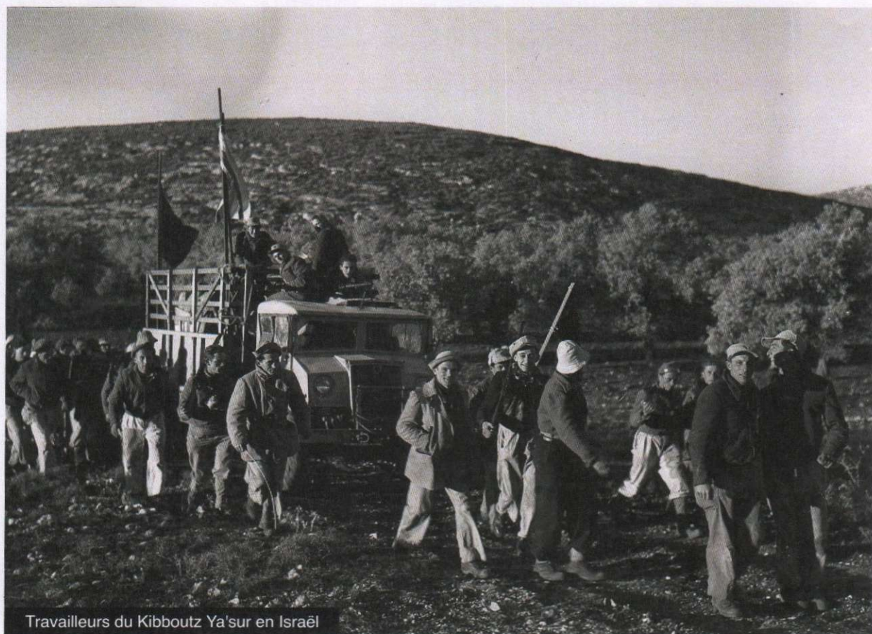
Travailleurs du Kibboutz Ya'sur en Israël

kine dans les milieux sionistes socialistes. L'amitié qui liait Landauer avec le penseur juif Martin Buber (1878-1965), spécialiste du hassidisme, depuis leur rencontre dans un cercle intellectuel en 1899, fera que ce dernier sera son exécuteur testamentaire, publiera des recueils de ses œuvres et, dans son sillage, poursuivra sa réflexion sur le socialisme comme communauté des communautés 5 .