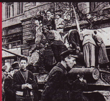
Hongrie Conseils ouvriers en 1956