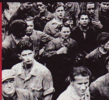
Témoignage d'un militant chez Renault en 1947