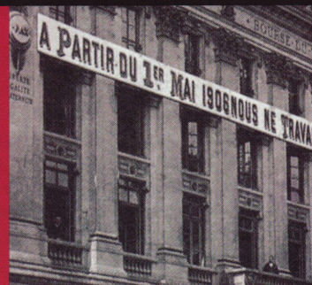
Amiens 1906 La référence du syndicalisme