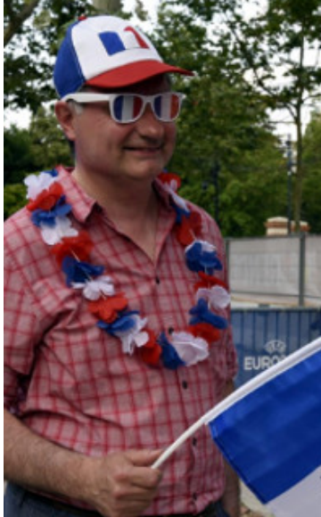
Jean-Luc Moudenc, Maire de Toulouse - Fan zone lors de la Coupe d'Europe de football en juin 2016.