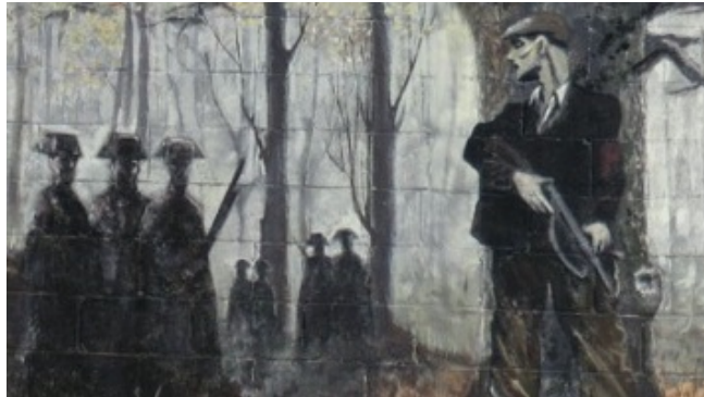
Mural - Maquis Sallent