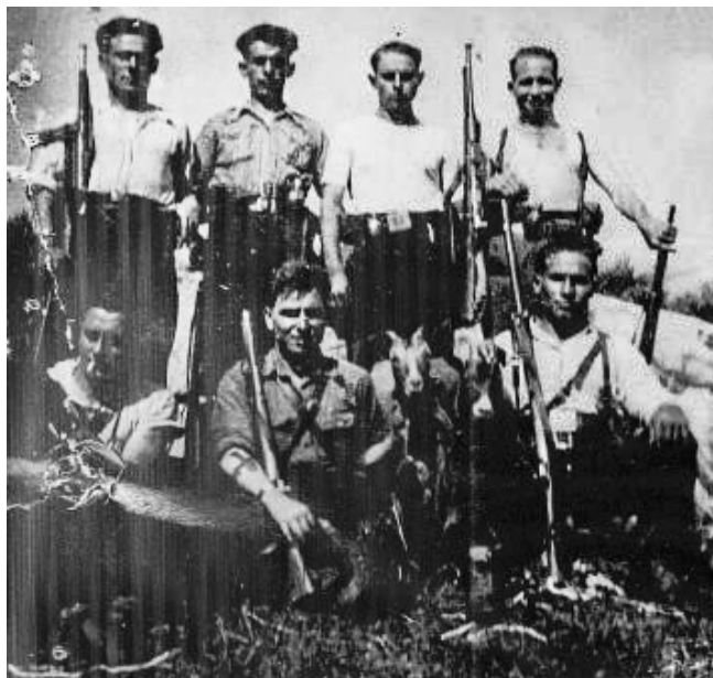
Groupe Santeiro (Leon Asturies)