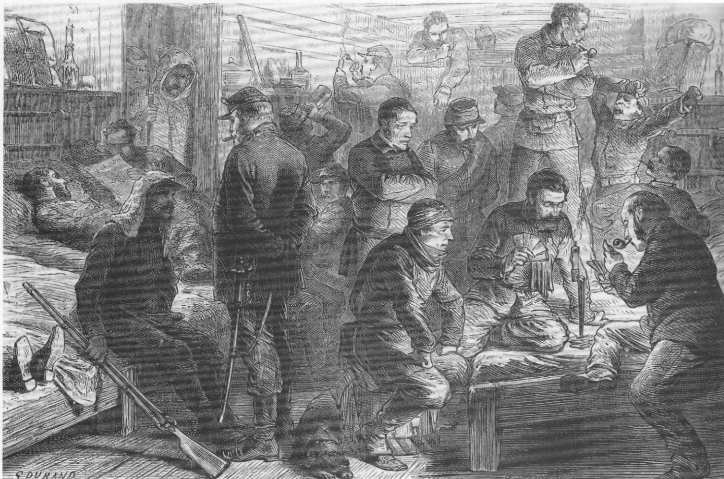
La Garde nationale au repos. Intérieur d'une baraque. The Graphic, 1870.

●●● tère des élections de Paris, et sur le choix des candidats, sollicitent instamment leurs camarades, gardes mobilisés, sédentaires et civiques, de nommer demain dimanche un délégué pour chaque circonscription, lequel devra assister à la réunion [...]. Cette invitation est faite sans aucun esprit exclusif de parti ou d'opinion, mais dans le but de convoquer toute la Garde nationale à de grandes assises, d'où doivent sortir des résultats féconds pour la Patrie et la République. »