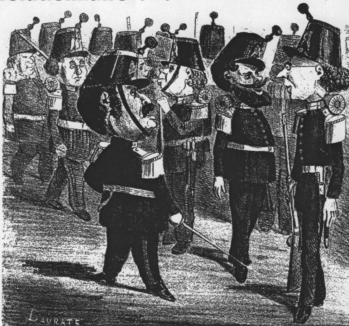
La Garde nationale. « Plaçons-nous, Messieurs, s'il vous plaît, les beaux hommes au premier rang ! », illustration d'Edmond Lavrate.

Née avec la Révolution, la Garde nationale, troupe de citoyens chargée du maintien de l'ordre, est réactivée en 1870 pour défendre Paris contre les Prussiens. Elle s'organise alors en système de démocratie directe.