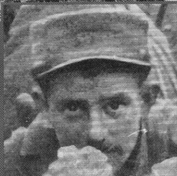
Résistances Les poilus contre la hiérarchie