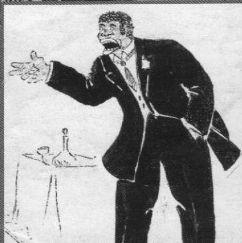
Harlem, 1920 Un nationalisme noir radical