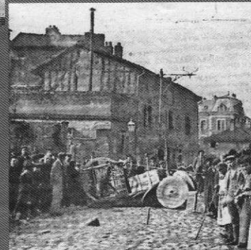
Grèves Les barricades de Limoges (1905)